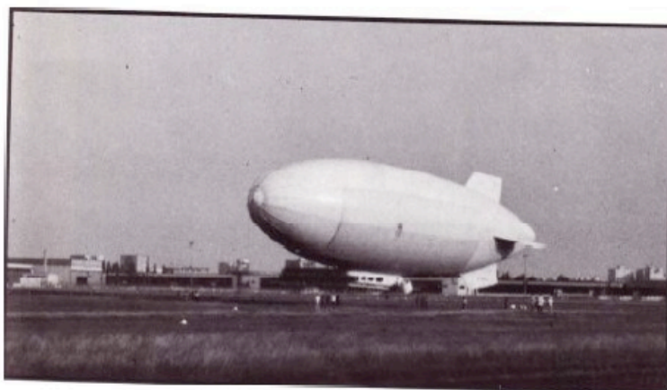
Capitaine BOUDIN CDCZ 04.930 LYON

L'opération PROPYLEE fut un succès puisqu'aucun incident n'est venu troubler les fêtes du Bicentenaire. Cela restera un souvenir inoubliable pour tous ceux qui ont participé à l'épopée du SKY SHIP.